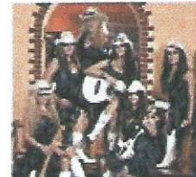
Country Sisters Le «Europa's first and best Country Girlband» participe pour la deuxième fois à notre croisière country.