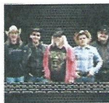
The TexMex Rebels Depuis des années, le groupe est resté fidèle à son style et s'est distancé du courant principal de la country.