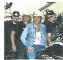
Buddy Dee & the Ghostriders Sauront certainement mettre une ambiance du tonnerre à bord comme lors de la première croisière.